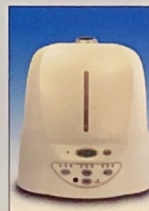
専用超音波噴霧器