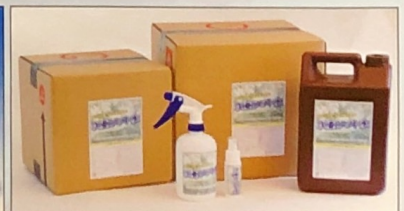
次亜ソフト水各種

製造業者 有限会社 シー・エムエンジニアリング 〒388-8011 長野県長野市篠ノ井布施五明140-1